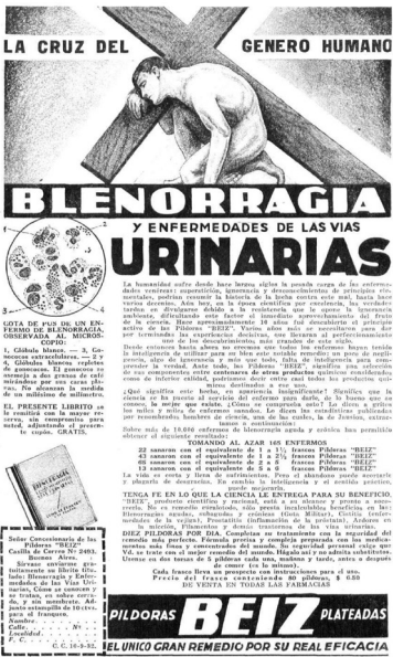
Imagen N° 4. Caras y Caretas (Buenos Aires), 30 agosto 1932.

Los recursos textuales novedosos de esta publicidad incluían la opinión de supuestos usuarios a través de cartas dirigidas a su inventor en las que se valorizaban la efectividad y la velocidad de acción. De todos modos, las distintas tácticas con las que estos anuncios insistieron en el carácter efectivo de sus tratamientos se corresponden con la búsqueda de un prestigio precario, debido a que hasta la revolución bacteriológica y el descubrimiento de la penicilina, varias décadas después, todos los procedimientos farmacológicos estaban plagados de falencias.