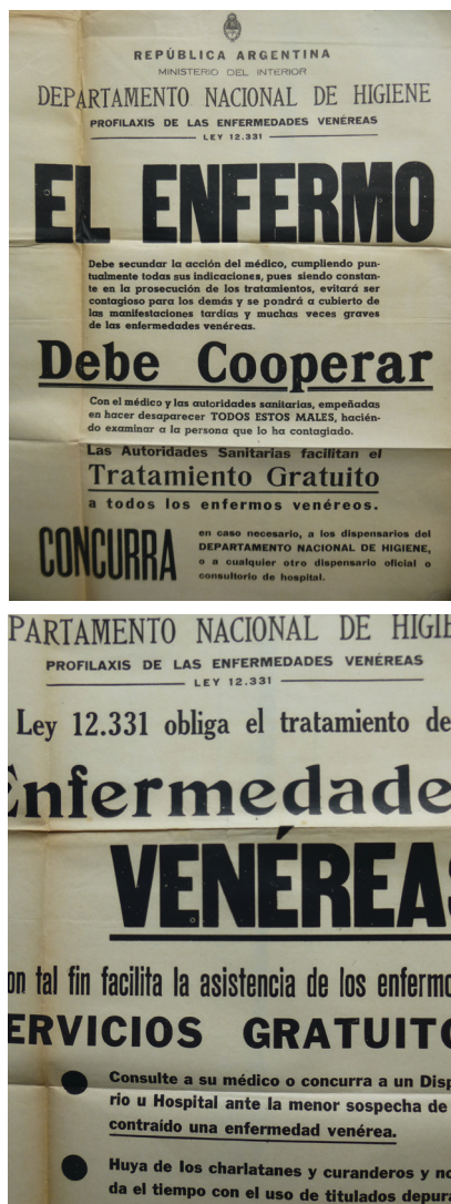
Imagen N° 7 y N° 8. Afiches públicos, Archivo General de la Nación. Archivo General de la Nación. Archivo Ministerio del Interior, caja 9, doc. 316.

métodos de la publicidad y ocupando un lugar importante en el aparato burocrático-administrativo del Estado (González Leandri).