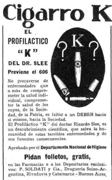
Imagen N° 2. Caras y Caretas (Buenos Aires), 23 septiembre 1916.

Una década más tarde comenzó a anunciarse el cigarro suizo K (imagen N° 2), que prometía la erradicación de las enfermedades de transmisión sexual. A diferencia del anterior medicamento, apuntaba al carácter de prevención del dispositivo médico. La figura de la sanación era revertida hacia la anticipación del contagio, lo que apelaba a la responsabilidad del individuo sobre el cuidado autónomo de su propia salud.