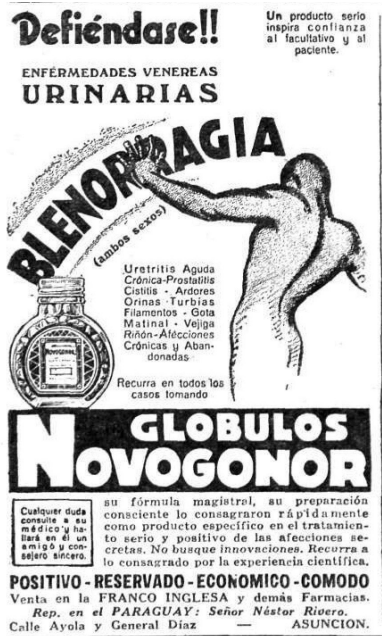
Imagen N° 5. Caras y Caretas (Buenos Aires), 8 agosto 1936.