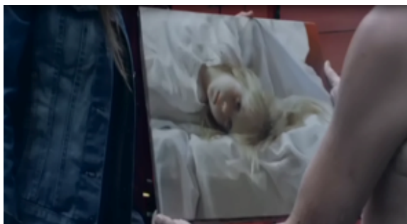
Imagen 1. Una de las pinturas con niñas del joven Lorca.

por qué no, de la muerte y el contingente cruce de fronteras (Imágenes 1 y 2). ¿Qué representan esas niñas angelicales e impertérritas? ¿Serán un aviso de la violencia que se aboca sobre los afectos de Mane o es la frontera de la inocencia perdida y la entrada a un ámbito adulto de inequidades insuperables y ancestrales?