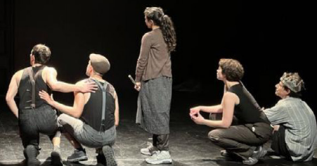
IMAGEN 3 Y 4.

Y piensa en la infinidad de las piedras y las plantas. Piensa en los mitos fundadores, piensa en las imágenes, y piensa en ella y piensa en ellos.