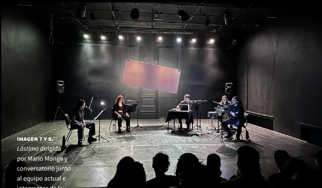
IMAGEN 7 Y 8. Lástima dirigida por Mario Monge y conversatorio junto al equipo actual e integrantes de la Cía. Teatro La María.